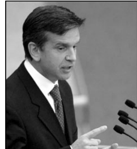
Министр здравоохранения и социального развития Михаил Зурабов

2. Новые профсоюзы , написавшие на своих знаменах лозунг независимости от властей и работодателей, остаются малочисленными (по самой оптимистической оценке – не более 1,5% занятых). Их