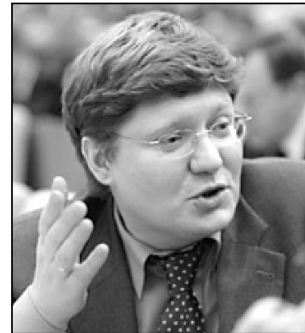
Глава Комитета Госдумы по труду и социальной политике Андрей Исаев

численность не растет. А в условиях действия нового Трудового кодекса влияние и даже численность новых профсоюзов уменьшаются.