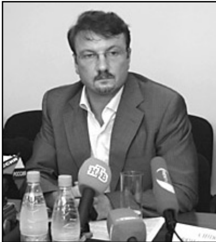
Министр экономического развития и торговли России Герман Греф

Почему и старые (ФНПРовские), и новые профсоюзы России не защитили и не защитят трудящихся от губительной социальной политики властей и капитала?